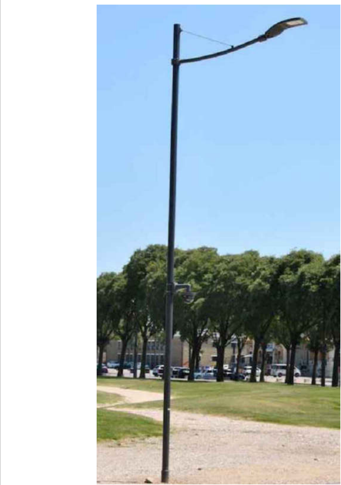
COMPLESSO ILLUMINANTE CON ARMATURA STRADALE TIPO WOW DELLA DITTA IGUZZINI - ESEMPIO DI APPLICAZIONE