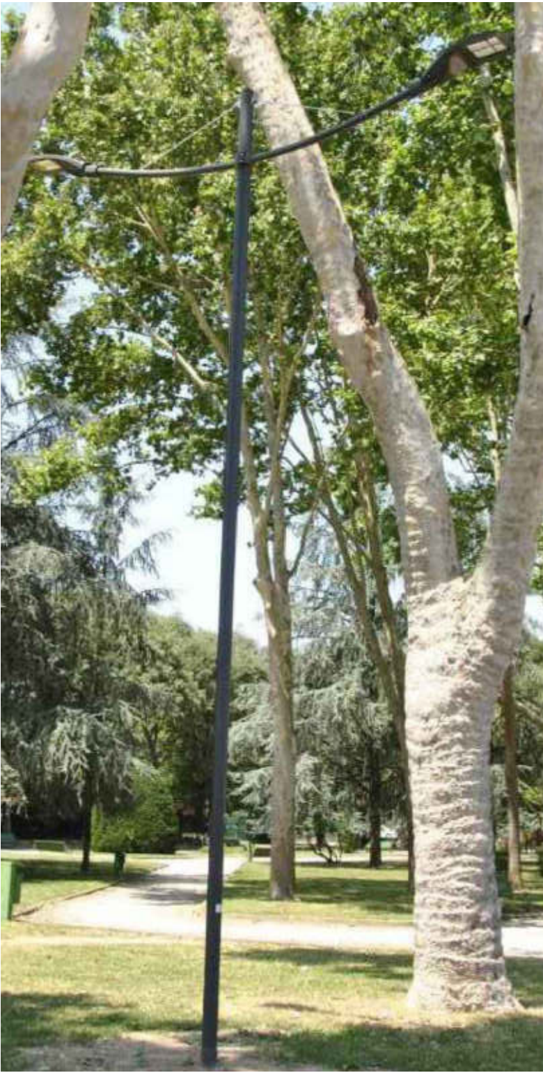
COMPLESSO ILLUMINANTE CON ARMATURA STRADALE TIPO WOW DELLA DITTA IGUZZINI - ESEMPIO DI APPLICAZIONE